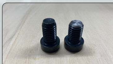
TAGLIO VITI CON SMUSSO

Ci occupiamo dal 2008 solo ed esclusivamente di quello, il nostro lavoro è focalizzato nell' accorciare viti , nel far gole o scarichi sottotesta , nella ripresa totale della vite con parziale filetto, troncandone la parte filettata e intervenendo sulla parte liscia cambiandone totalmente il filetto. Riprendiamo le viti allungandone il filetto, possiamo trasformare il filetto dal classico iso destro, a sinistro.